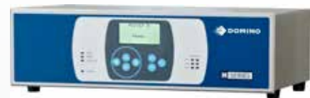
Unità di controllo