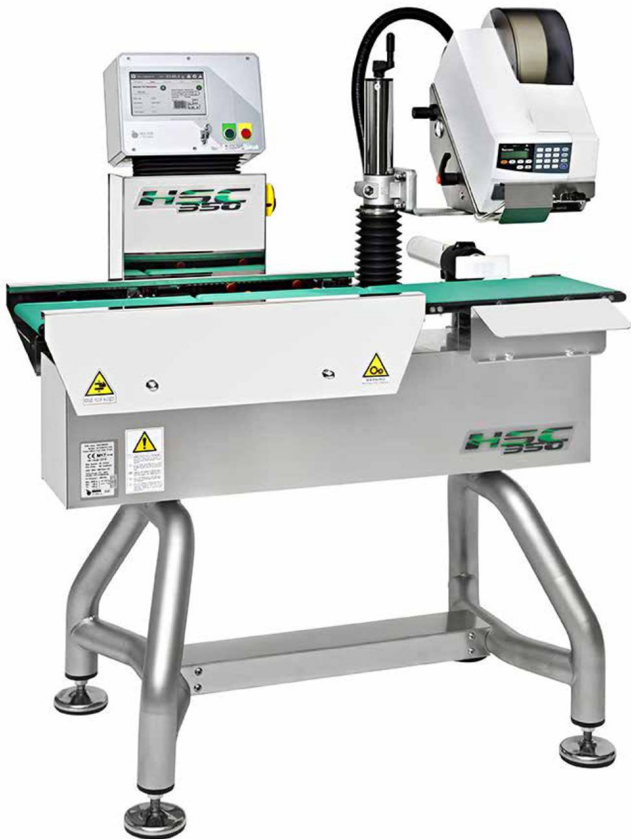
Serie K applicatore top